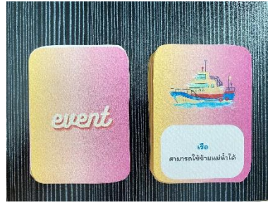
การ์ดอีเวนต์