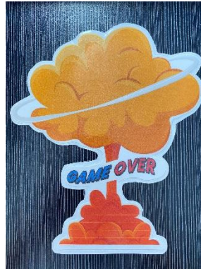
สัญลักษณ์การแพ้เกม