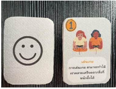
การ์ดความสุข