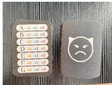
การ์ดความทุกข์