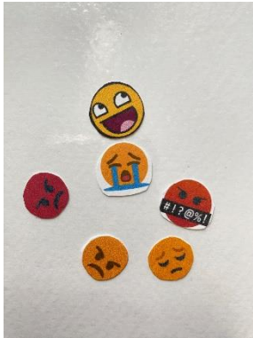
แต้มอารมณ์